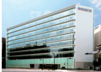
akebono日本橋ビル (東京都中央区)***

*Ai-City:2001年、各地に分散していた諸機能を集約し、営業、管理などの業務統合と仕事の進め方の抜本的変革、ITの活用による業務効率と価値創出の効果を最大化することを目的として設立しました。Ai-CityのAiには、「Akebono Innovation(曙の改革)」[IT(情報技術)]また、埼玉県羽生市が武州藍染ゆかりの地域であることから「藍」の意味を込めています。