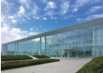
Akebono Crystal Wing (ACW)** (埼玉県羽生市)