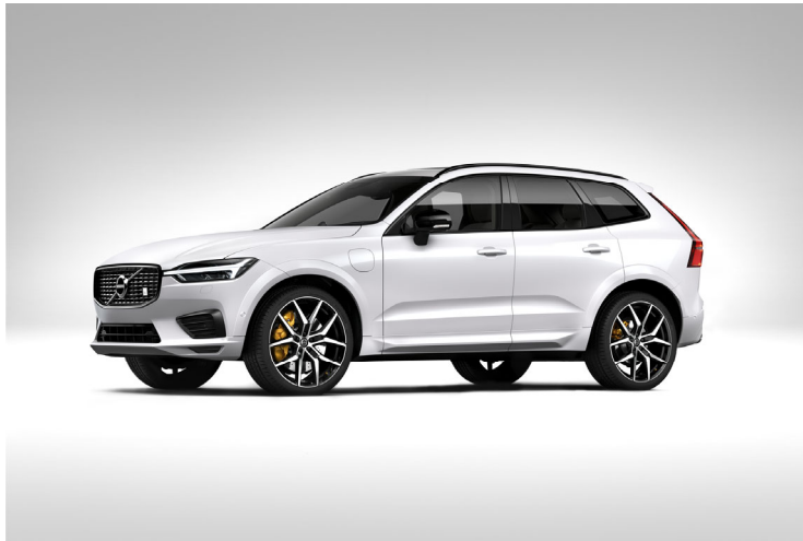
ボルボ XC60 T8 Polestar Engineered

今回採用されたブレーキキャリパーは、高級車・高性能車向けに開発したアルミ製モノブロック対向6ピストン型キャリパーで、高性能パッドと併せて、高速、高負荷、高温制動時の高いブレーキ性能と、高価格車としての快適性といった特性を実現しています。